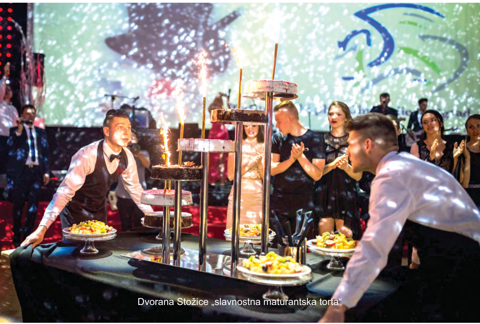
Dvorana Stožice „slavna maturanška torta“