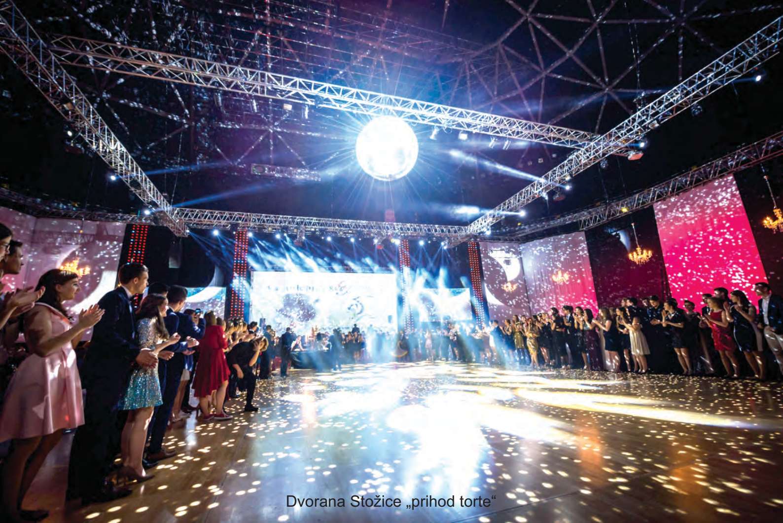
Dvorana Stožice „prihod torte“