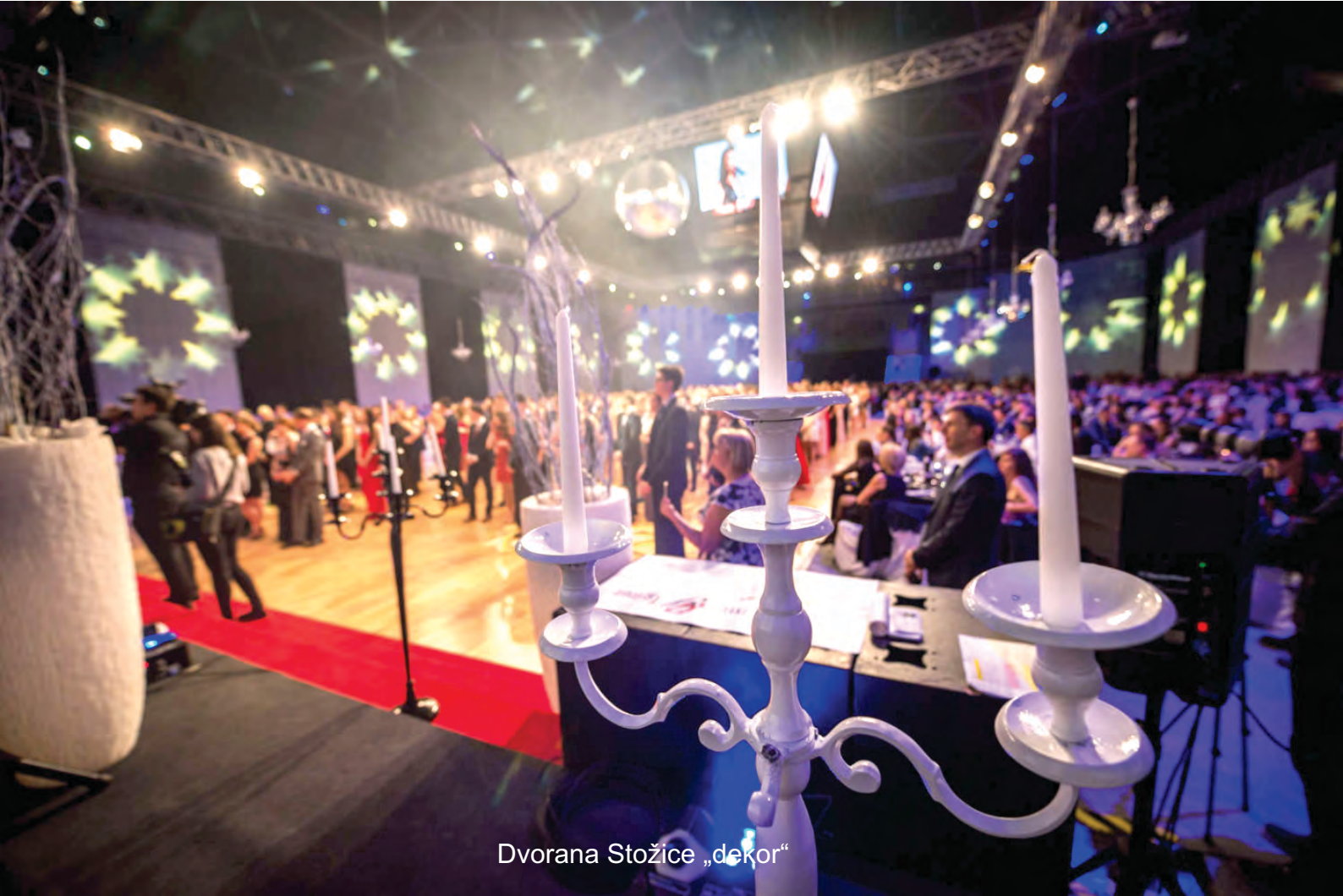
Dvorana Stožice „dekor“