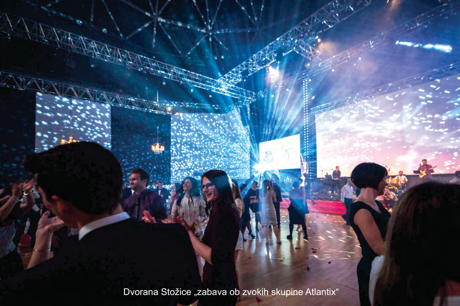
Dvorana Stožice „zabava ob zvokih skupine Atlantix“