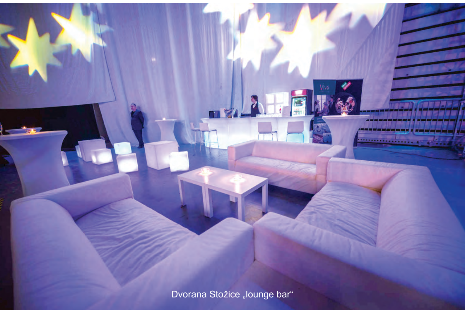
Dvorana Stožice „lounge bar“