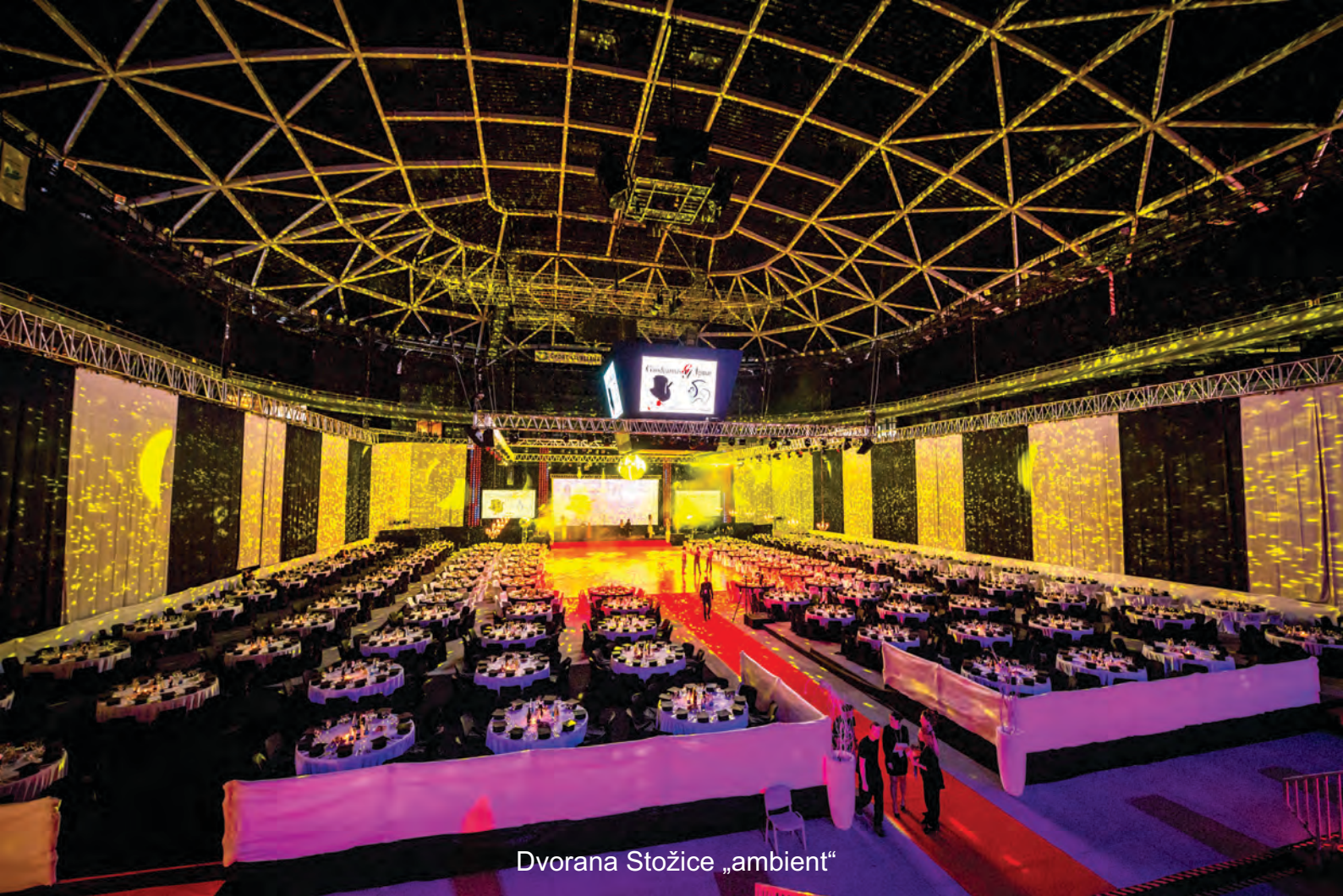
Dvorana Stožice „ambient“