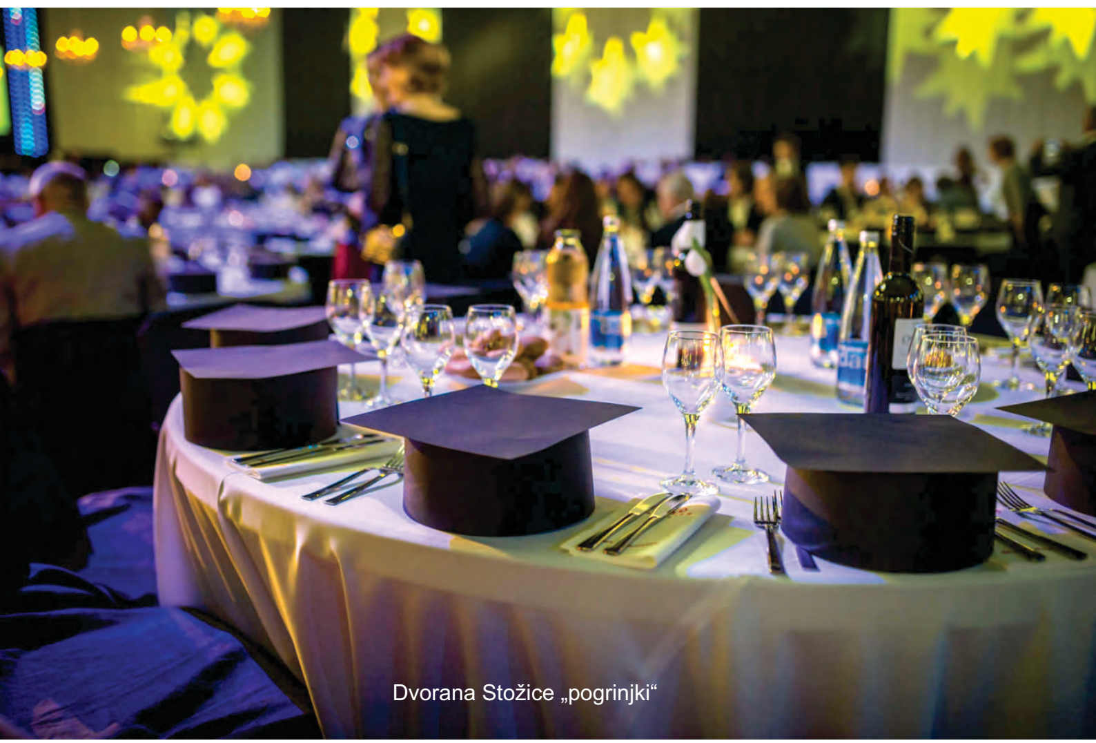
Dvorana Stožice „pogrinjki“