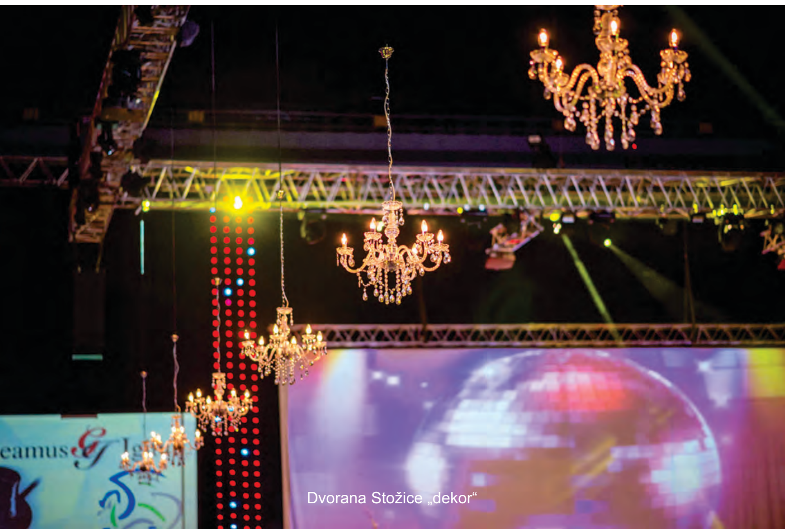
Dvorana Stožice „dekor“