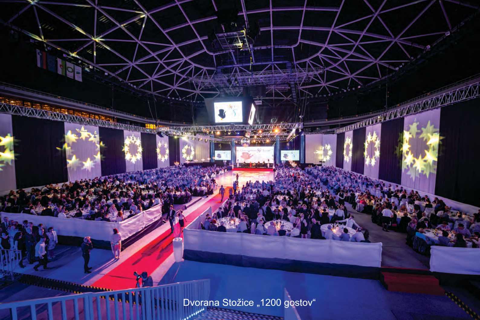
Dvorana Stožice „1200 gostov“