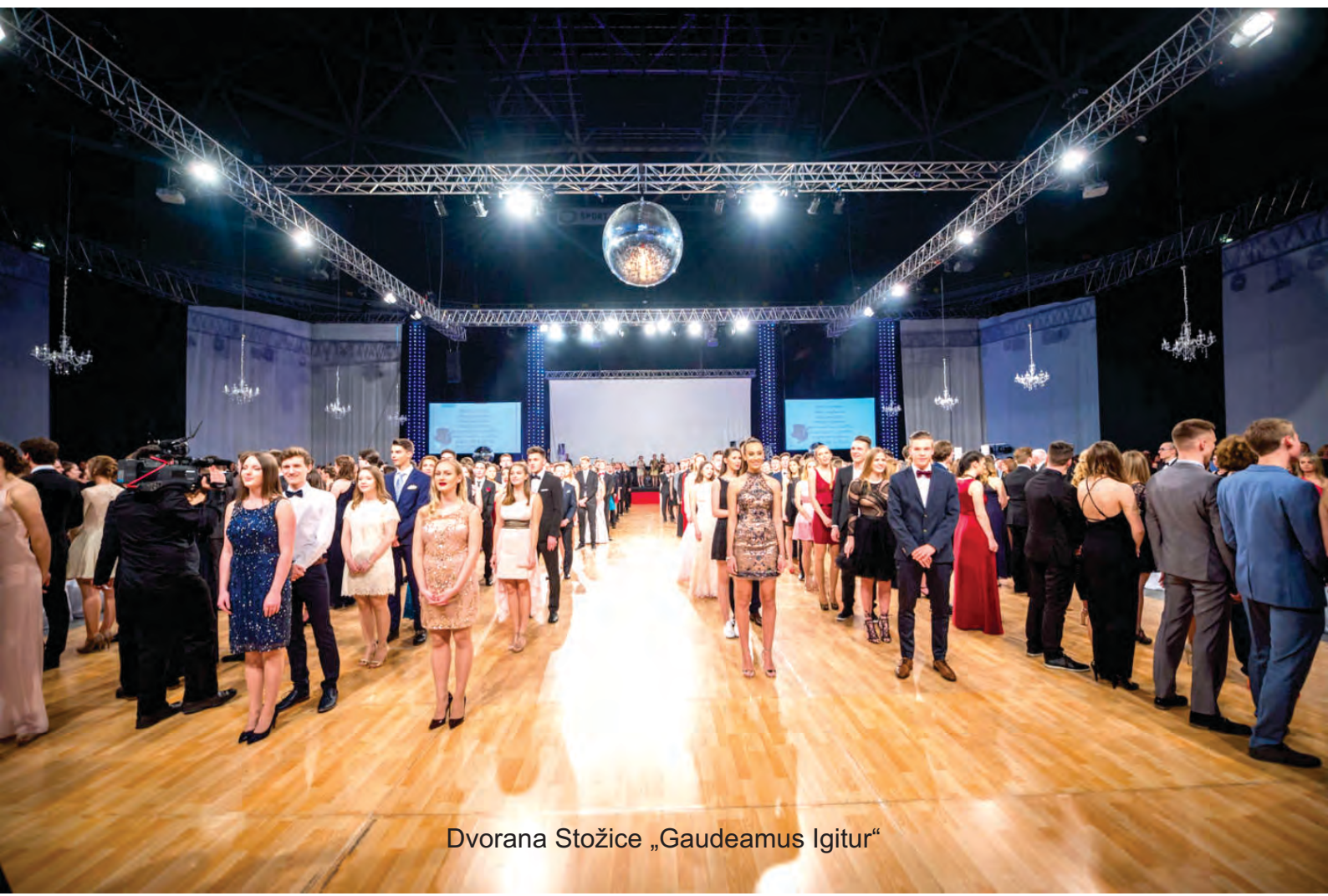
Dvorana Stožice „Gaudeamus Igitur“