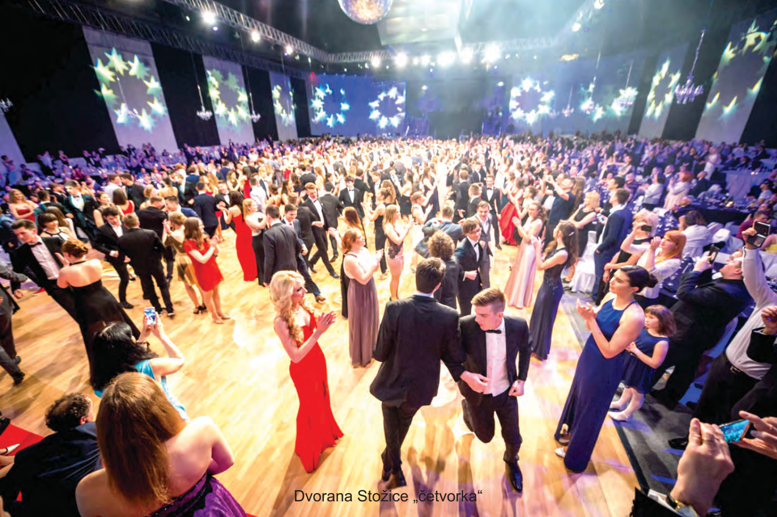
Dvorana Stožice „čtvorka“